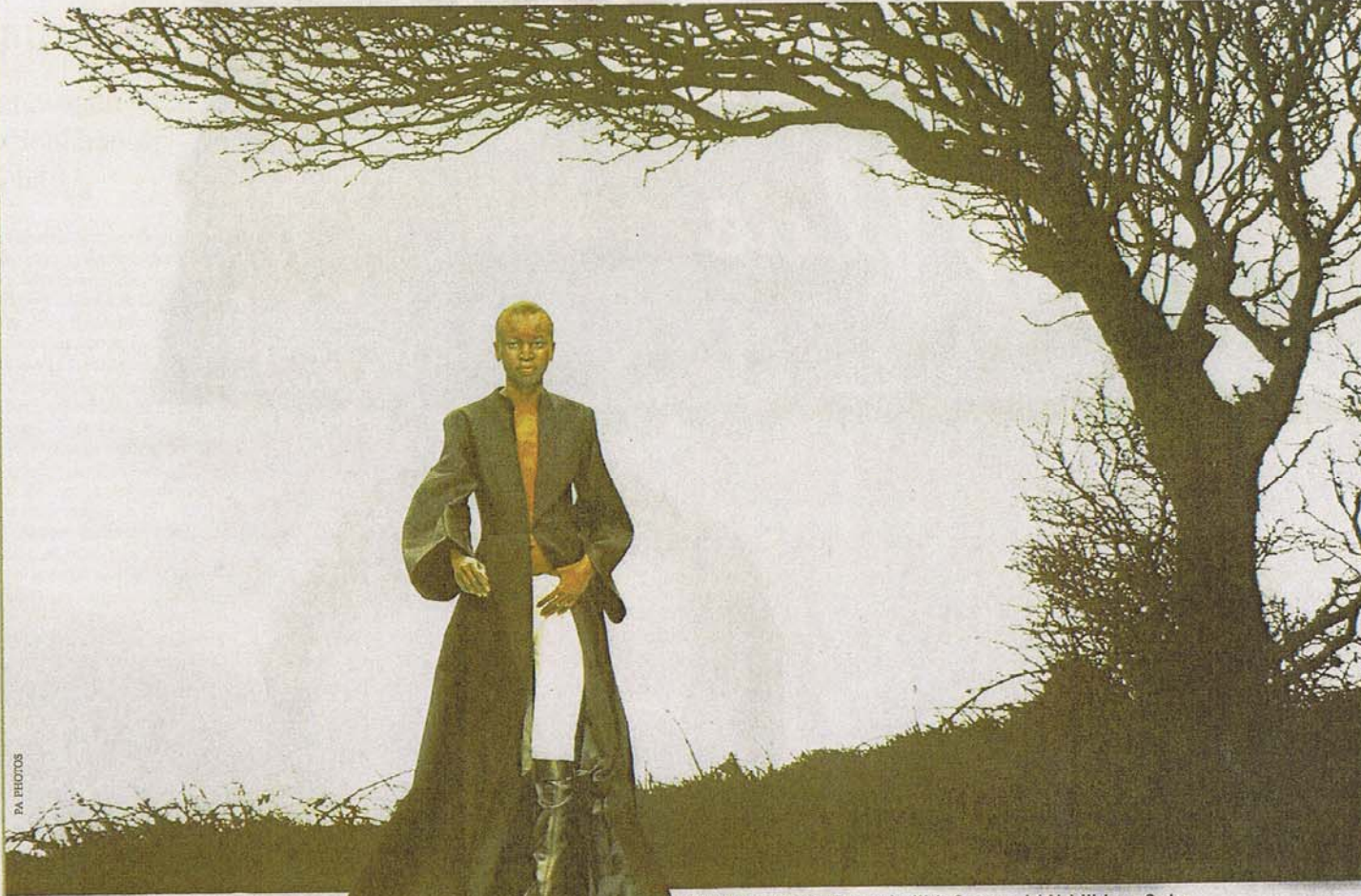
Eine der schönsten Frauen der Welt: Supermodel Alek Wek aus Sudan